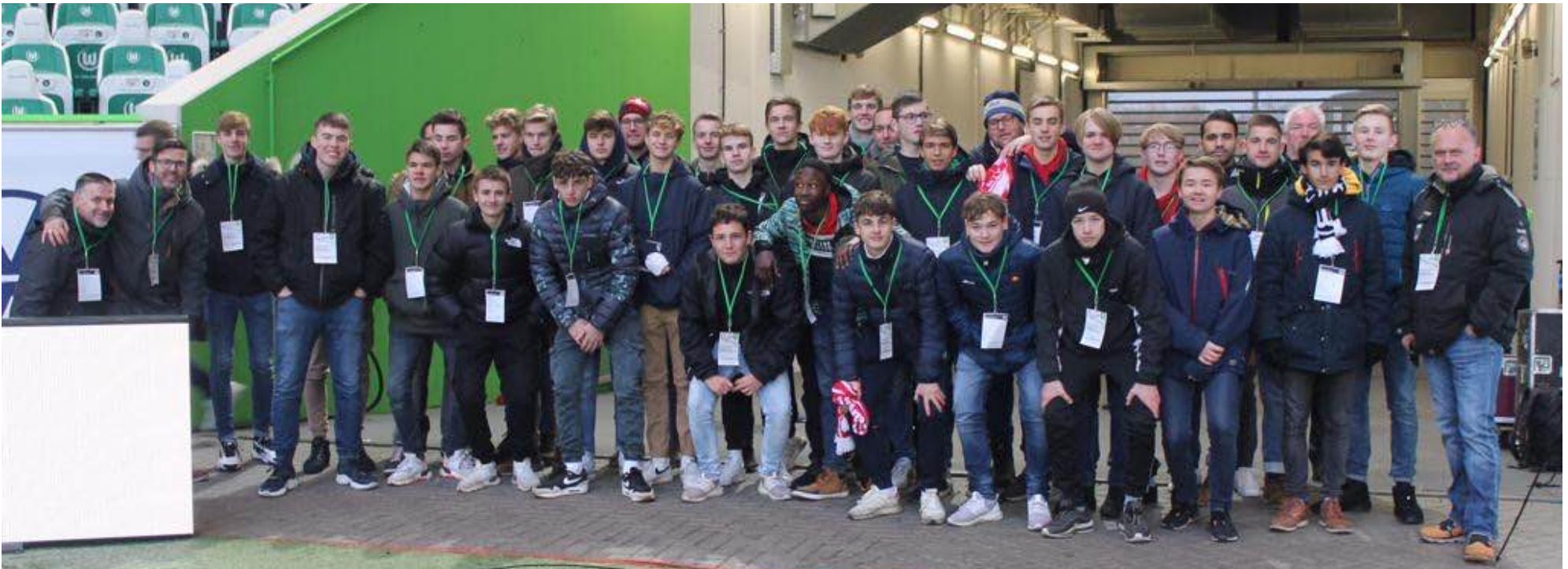
Hier beim Besuch des VfL Wolfsburg